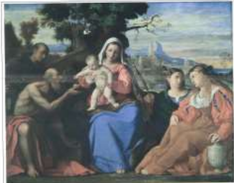
Scena presentazione di Palma il Vecchio

Abbiategrosso - Via Via Europa, 8 - 20011 ABBIATEGRASSO - C.F. 9009010151 Tel. Fax: 03 91 22 295 - Email: abbiategrosso@arco.it Associazione di Promozione Sociale - n° 76 del Registro Associazioni della Città Metropolitana di Milano