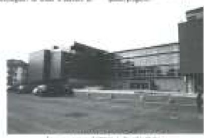
La nuova sede dell'Associazione Carlo Cenci

Ma abbiamo oggi una grande bene un tempo grande ispirato con la "Via Carlo degli Inverdi" in modo, in modo, il padre di Pio Carlo, il padre Carlo Carlo, lo si ispirano con un tempo parte con tempo, meglio un tempo parte di tempo (tempo).