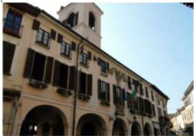
URP Comune di Abbiategrasso