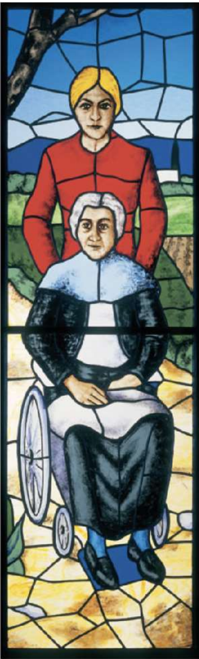
Sigfrido Bertolini - Visitare gli infermi, vetrata - Chiesa dell'Immacolata, Pistoia